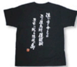
「しげさ館」 Tシャツ+プリント ¥2600円