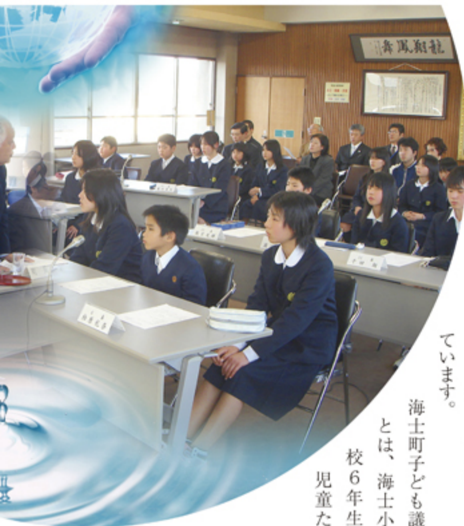
海士町子ども議会とは、海士小学校6年生の児童たち

今から2年前の平成20年2月。から海士町で「エコポイントカード制度」を導入しました。これたちからレジ袋使用削減については協賛店で買い物をした際、レジでの提案がありました。これを受袋を断る毎にポイントカードに付けて隠岐國商工会(※)では、同ポイント(シール)がひとつも年5月の通常総会において緊急らえ、15ポイントで海士町指定事案として決議。約1年の準備のごみ処理券(¥70)1枚と交換期間を経て、平成21年4月24日換えられるというもので、消費者にとっても嬉しい仕組みとなっています。