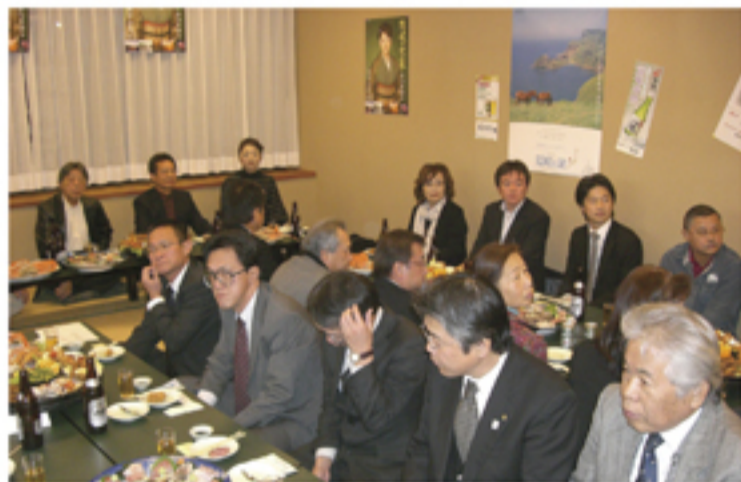
●作詞・作曲の先生方や音楽関係者と地元で懇談会

この曲は、新しいスタイルでの隠岐のPR方法を試行錯誤している中から誕生した。あらゆるジャンルで大量の楽曲が消費されていく現代の音楽界であるが、演歌は息が長く、また根強いファンが多い。こうした演歌ファンを中心に、隠岐の知名度アップを目指そうという試みがユニークだ。平成21年10月29日には「隠岐の恋歌発表会プロジェクト」が発足し、曲の発売と地元発表会の実現をバックアップする体制も整えられた。 CDジャケットの中面には隠岐の風景が数点、ポスターの下部には隠岐各島を代表する写真が並ぶ。通信カラオケでは今後、隠岐4町村