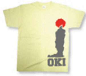
「ローソク島」 Tシャツ+プリント ¥2400円