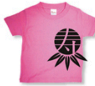
「南」 Tシャツ+プリント ¥2500円