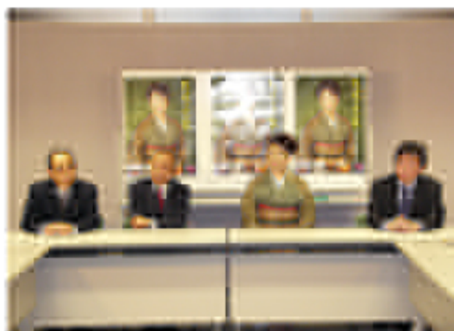
◆新築住宅見学で理事