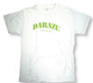
「DARAZU」 Tシャツ+プリント ¥2000円