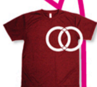
「飯田馬村」 Tシャツ+プリント ¥2000円