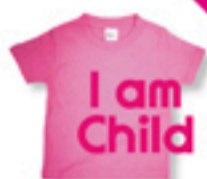
「I am child」 Tシャツ (100cm)+プリント ¥2000円