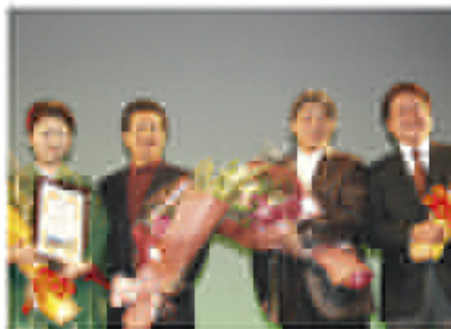
◆ノアホーム贈り物で親光大使を訪問