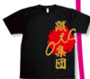
「隠岐乃国球技協会」 Tシャツ+プリント ¥2900円