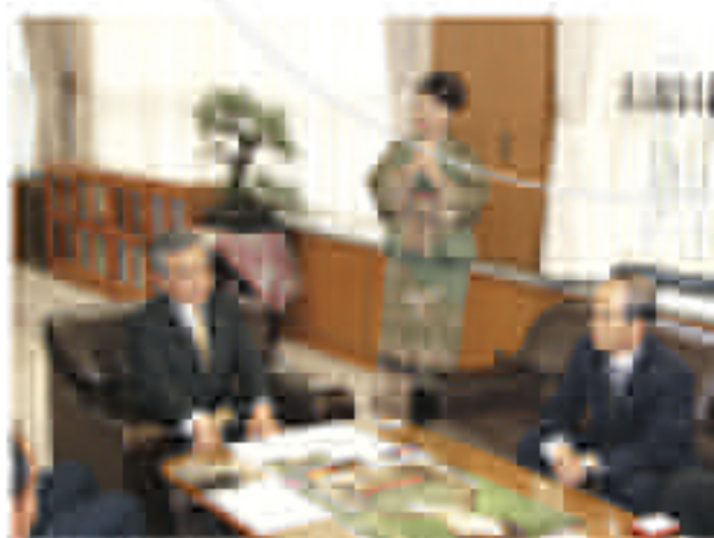
◆新築住宅見学で生協理事を訪問