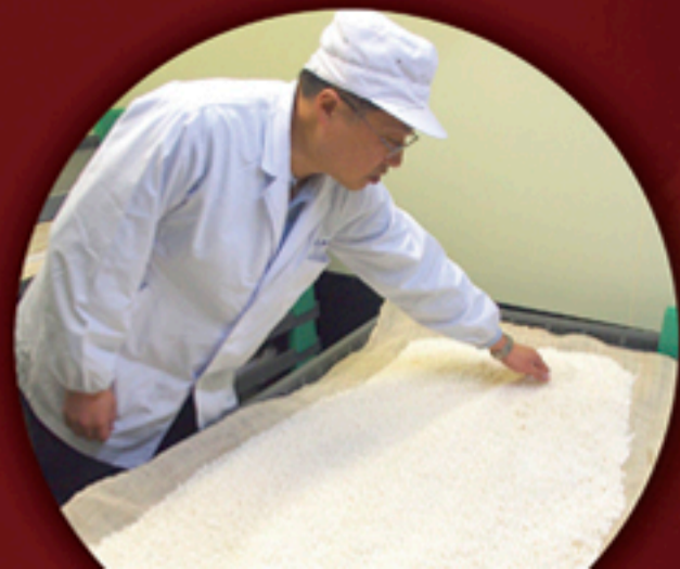
隠岐酒造株式会社、新酒仕込みの様子(今号に関連記事掲載)