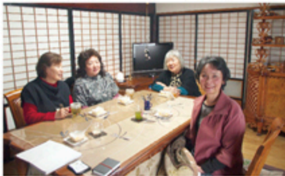
お茶友たちとティータイム。ハーブティーなどで気分転換。

とつ、アロマセラピー認定アドバイザーという顔も持つ。アロマセラピーとは、植物から香りや成分を抽出・濃縮した精油を用いた植物療法のこと。最近ではアロマオイルを加湿器や空気清浄機などに垂らして、その香りを楽しんでいる方も多いのではないだろうか。香りによって気分をすっきりさせたり、寝つきを良くしたりと、体調をコントロールすることもできる。実はこれがカウンセリングにも有効なのだ。カウンセリングが「話す」とによって心と感情を解