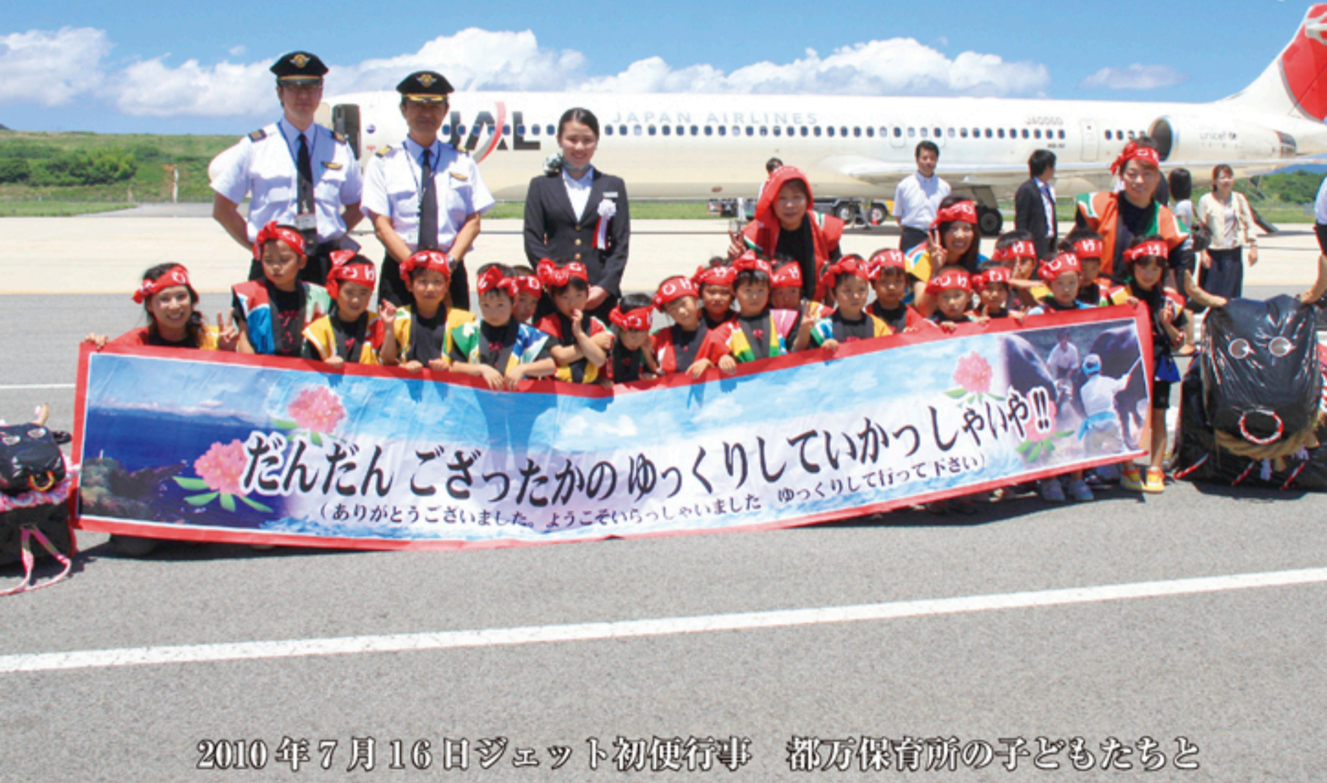
2010年7月16日ジェット初便行事 都万保育所の子どもたちと