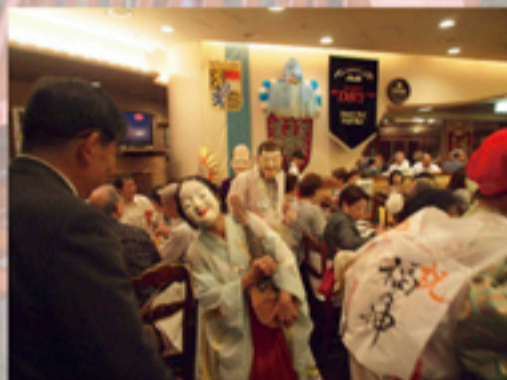
お馴染み七福神が、皆様に福を持ってきました～